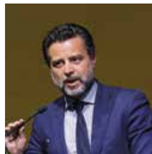
Emanuele Moraschini, presidente della Provincia di Brescia