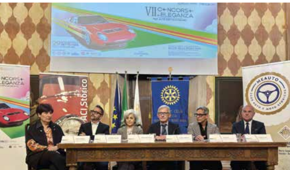
Il tavolo delle autorità durante la Conferenza Stampa di presentazione dell'edizione 2024

B ellezza, stile, fascino senza tempo. I motori già scalpitano in vista della settima edizione del Concorso di Eleganza per auto d'epoca Meano organizzato dal Rotary Club Brescia – Meano delle Terre Basse, giunto quest'anno alla VII edizione che si terrà domenica 29 settembre 2024. Un percorso on the road attraverso le Terre Basse che ha tra gli obiettivi quello di sensibilizzare pubblico e partecipanti sulla realizzazione di percorsi formativi per il restauro di auto d'epoca.