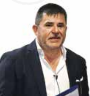
A cura di Carlo Piccinato Segretario Generale di Confindustria Imprese Lombardia Coordinatore nazionale "Team Transizione Ecologica"