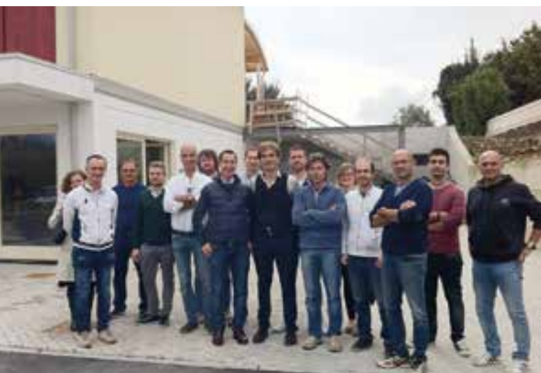
Il gruppo di Confartigianato Imprese Unione di Brescia in visita ai cantieri Nulli di Iseo

La visita ai Cantieri Nulli è stata un'occasione per approcciarsi a questo metodo costruttivo innovativo ed alternativo, con lo scopo di poter ampliare il ventaglio delle opportunità lavorative per gli artigiani del settore edile.