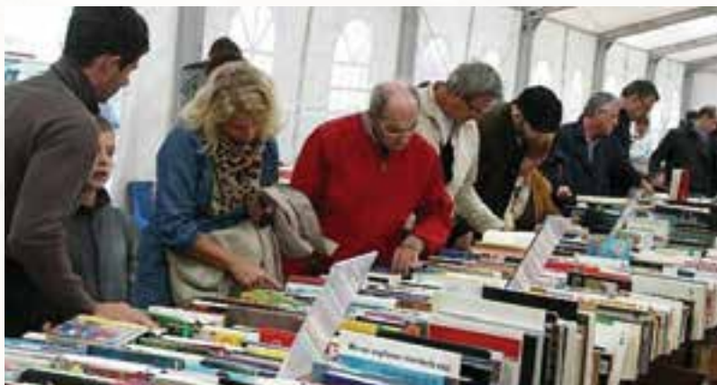
Lettori sotto la tensostuttura di Piazza Vittoria