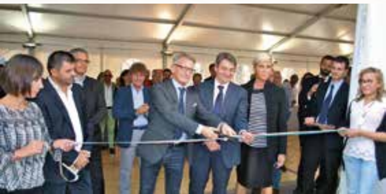
4 ottobre, il taglio del nastro alla presenza del presidente Eugenio Massetti, del sindaco Emilio Del Bono e del vicesindaco Laura Castelletti

«Librixia non può che crescere, non è vero che Brescia non legge. Legge eccome. C'è tanta voglia di cultura: ma non chiamiamola più "Fiera", dal prossimo anno la formula sarà "Festival del libro"» conclude Massetti.